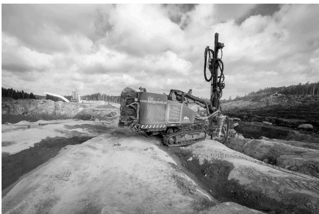
Nordisk Bergteknik är ett exempel på Pegrococos investeringar inom affärsområdet Tjänster & Service

Pegroco investerar inom Tjänster & Service framförallt i bolag med en beprövad affärsmodell, en stark marknadsposition, i sin region eller i sitt segment, samt ett över tid stabilt positivt kassaflöde. Pegrococos ambition är att ägarandelen i dessa bolag skall vara över 50 procent. Pegrococos urvalsstrategi bygger på att förvävsobjektet skall generera en väsentlig del av sina