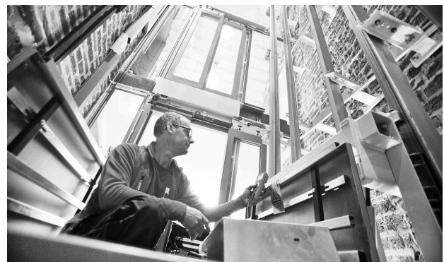
En av styrkorna hos RC Hisservice är att genomföra projekt för att modernisera äldre hissar.

RC Hisservice AB erbjuder heltäckande lösningar för alla typer av hissar. Bolaget både levererar och installerar nya hissar och utför service och moderniseringar av befintliga. Företaget startade 1977 och är med ett 40-tal medarbetare en ledande aktör i Västsverige. Bolagets säte är i Varberg och man har även filialer i Alingsås och Borås. För varje hiss finns ett serviceavtal som i vanliga fall omfattar löpande underhåll och 24/7 jourservice.