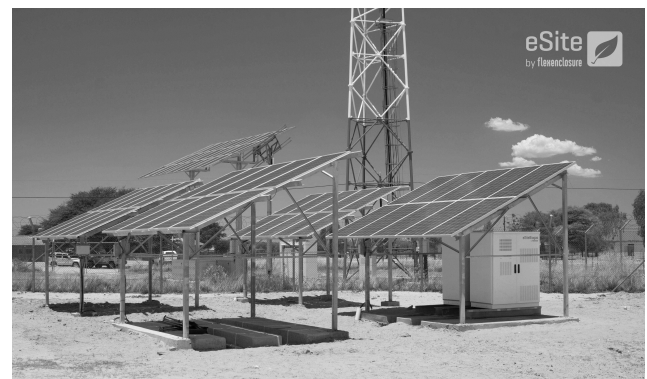
Teknikbolaget Flexenclosure är med sin produkt e-Site världsledande inom hybridenergi för telekom

intäkter från tjänster och underhåll. Dessa intäkter har fördelen att de ofta bygger på längre kontrakt och därmed har bättre förutsägbarhet. Vidare är sådan verksamhet ofta mindre kapitalintensiv, mindre konjunkturkänslig och mindre utsatt för tekniskiftet.